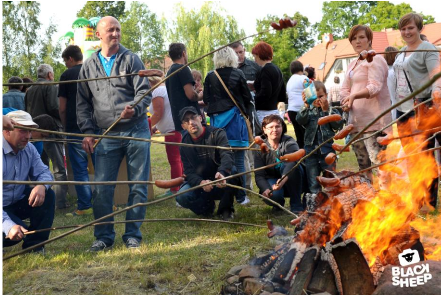
Warmińsko – Mazurskie Dni Rodziny rok 2014

W okresie od 18.05.2009 r. do 15.09.2009 r. Stowarzyszenie Przyjaciół Gminy Płońnica zrealizowało projekt dofinansowany z Programu Integracji Społecznej polegający na prowadzeniu świetlicy wiejskiej w Przełęku. Dzięki wsparciu finansowemu w wysokości 20 000,00 złotych świetlica została wyposażona w stół bilardowy, boisko do siatkówki, meble i stoły. Zatrudniono wychowawcę świetlicy i trenera zajęć sportowych. Zajęciami świetlicowymi objęto 30-cioro dzieci z Przełęka w podziale na dwie grupy wiekowe: 7-15 lat i 15-21 lat. Oprócz cotygodniowych zajęć plastycznych i sportowych zorganizowano wyjazd do aquaparku do Ostródy, wyjazd do stadniny koni w Malinowie, festyn dla mieszkańców wsi, trzydniowy biwak nad jezioro do Lidzbarka.