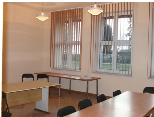
Budynek świetlicy wiejskiej w Przełęku zmodernizowany w latach 2011 -2015

Wśród zadań wskazanych do realizacji w Planie Odnowy Miejscowości z roku 2009 są takie, które nie zostały podjęte tj. budowa kanalizacji sanitarnej, budowa placu zabaw.