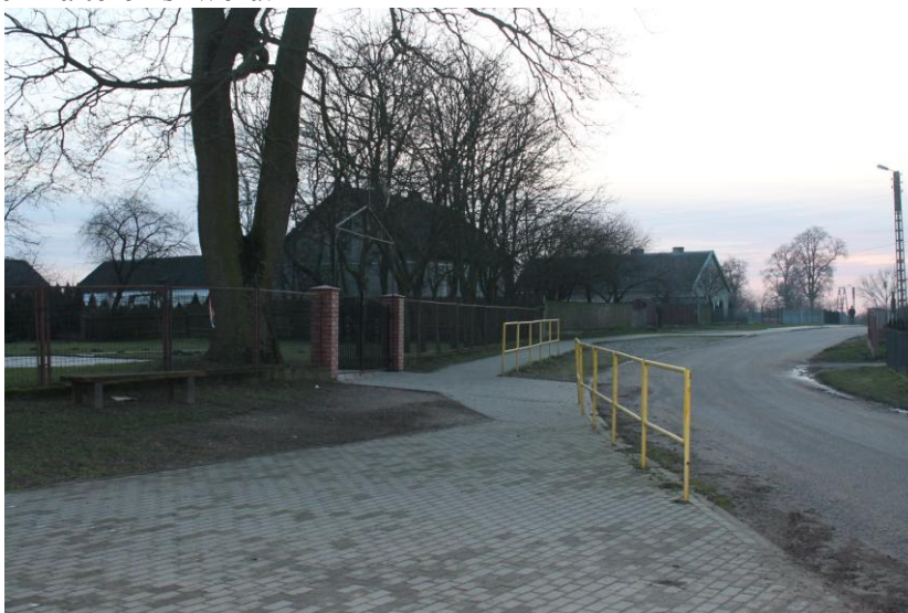
Budowa chodnika oraz urządzenie skweru przy Kościele w Przełęku

Mieszkańcy wskazali jednoznacznie, na zrealizowanie zadania polegającego na budowie chodnika oraz urządzeniu skweru przy kościele w Przełęku. Zadanie to zostało zrealizowane w roku 2010 przez Gminę Płońnica. Gmina na tę inwestycję pozyskała dofinansowanie ze środków UE w wysokości 59 244,00 zł w ramach Programu Rozwoju Obszarów Wiejskich na lata 2007 -2013. Wartość całej inwestycji wyniosła 93 076,51 zł. W efekcie na drodze gminnej nr 186028N w Przełęku Kościelnym powstała infrastruktura drogowa: chodnik o długości 483,60 m o szerokości 1,50 m z kostki betonowej grubości 6 cm na podsypce piaskowej grubości 5 cm i podbudowie z pospółki grubości 15 cm. Przy kościele urządzony został skwer i parking o powierzchni 232 m 2 , na podsypce cementowo-piaskowej i podbudowie z betonu. Od strony ogrodzenia Kościoła urządzono trawnik o powierzchni 120 m 2 . Na trawniku ustawiono 3 ławki parkowe. Ustawiono też poręcz ochronne o łącznej długości 35m by uniemożliwić wchodzenie zwierząt gospodarskich na teren skweru.