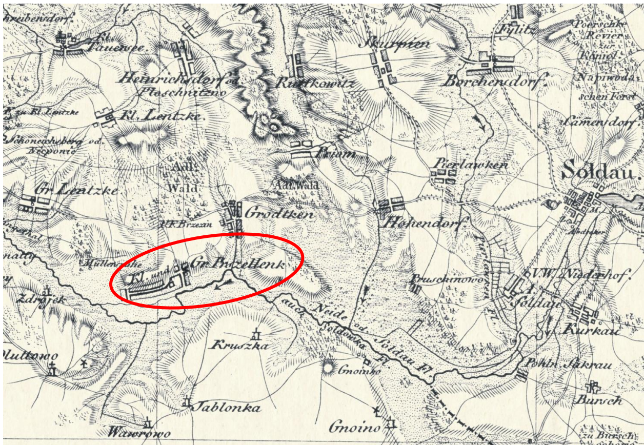
Źródło: Mapa Schröttera (lata 1796-1802)

W średniowieczu nazwę wsi zapisywano jako Waltersdorf lub Przelank . Z czasem wykształcił się podział na dwie wsie: Przełęk Duży i Przełęk Mały. Na mapie Schröttera (lata 1796-1802) widnieje Kl. und Gr. Prszellenk.