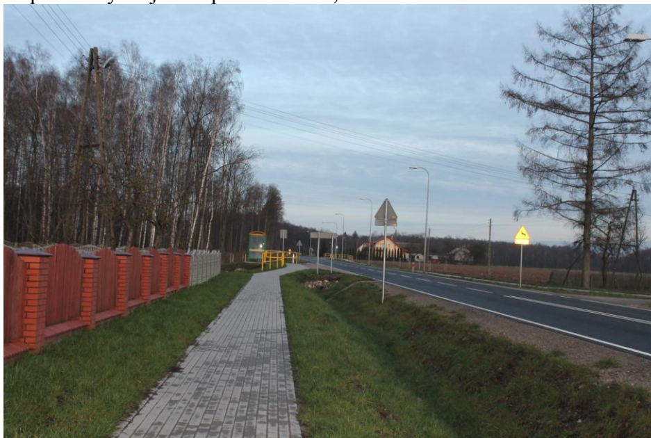
Zmodernizowana droga wojewódzka nr 544

Droga wojewódzka nr 544 została na całej swojej długości zmodernizowana w latach 2014-2015. Dzięki temu także w Przełęku powstała nowa infrastruktura tej drogi: nowa nawierzchnia jezdni wraz z podbudową oznakowaniem pionowym i poziomym, zatoki autobusowe, wyspy dzielące na jezdniach, bariery ochronne w miejscach newralgicznych dla bezpieczeństwa pieszych, ciąg pieszy odseparowany od jezdni pasem zieleni, oświetlenie uliczne.