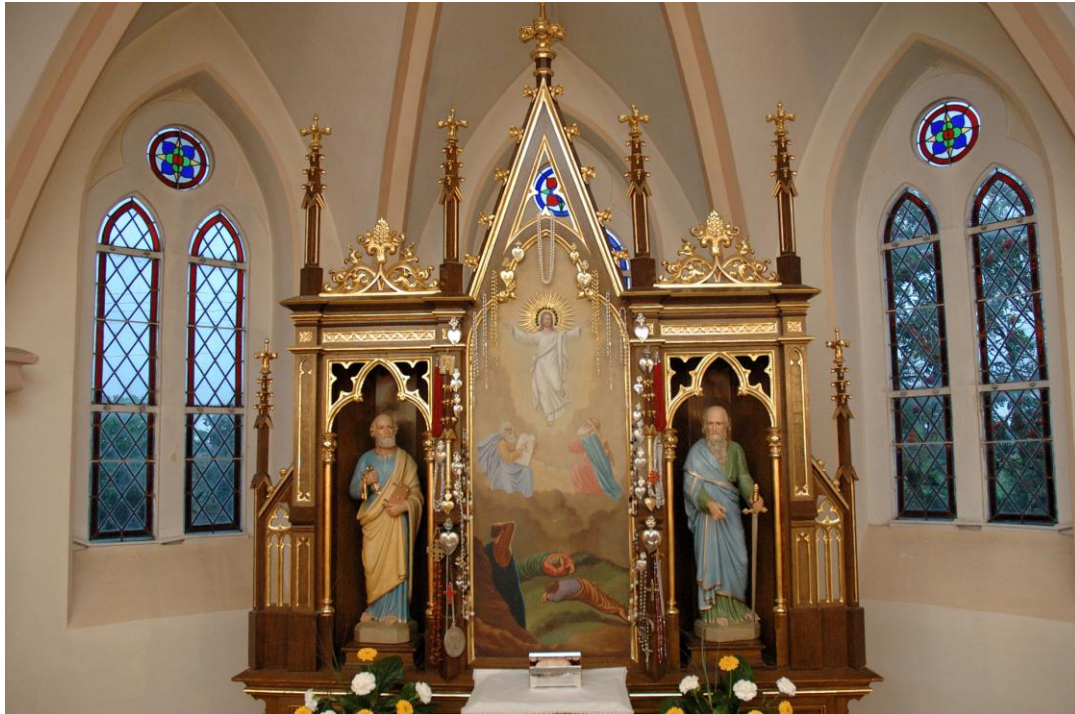
Pan Jezus Przemieniony w srebrnej aureoli

W roku 2001 parafia obchodziła jubileusz 100-lecia budowy kościoła. Z inicjatywy ks. proboszcza, kopia obrazu Jezusa Przemienionego nawiedzała wszystkie rodziny w parafii. Parafianie ufundowali srebrną aureolę, którą ozdobione zostało oblicze Chrystusa Przemienionego. Aktu tego dokonał biskup toruński w trakcie uroczystości Jubileuszowych w dniach od 5 do 12 sierpnia 2001 r.