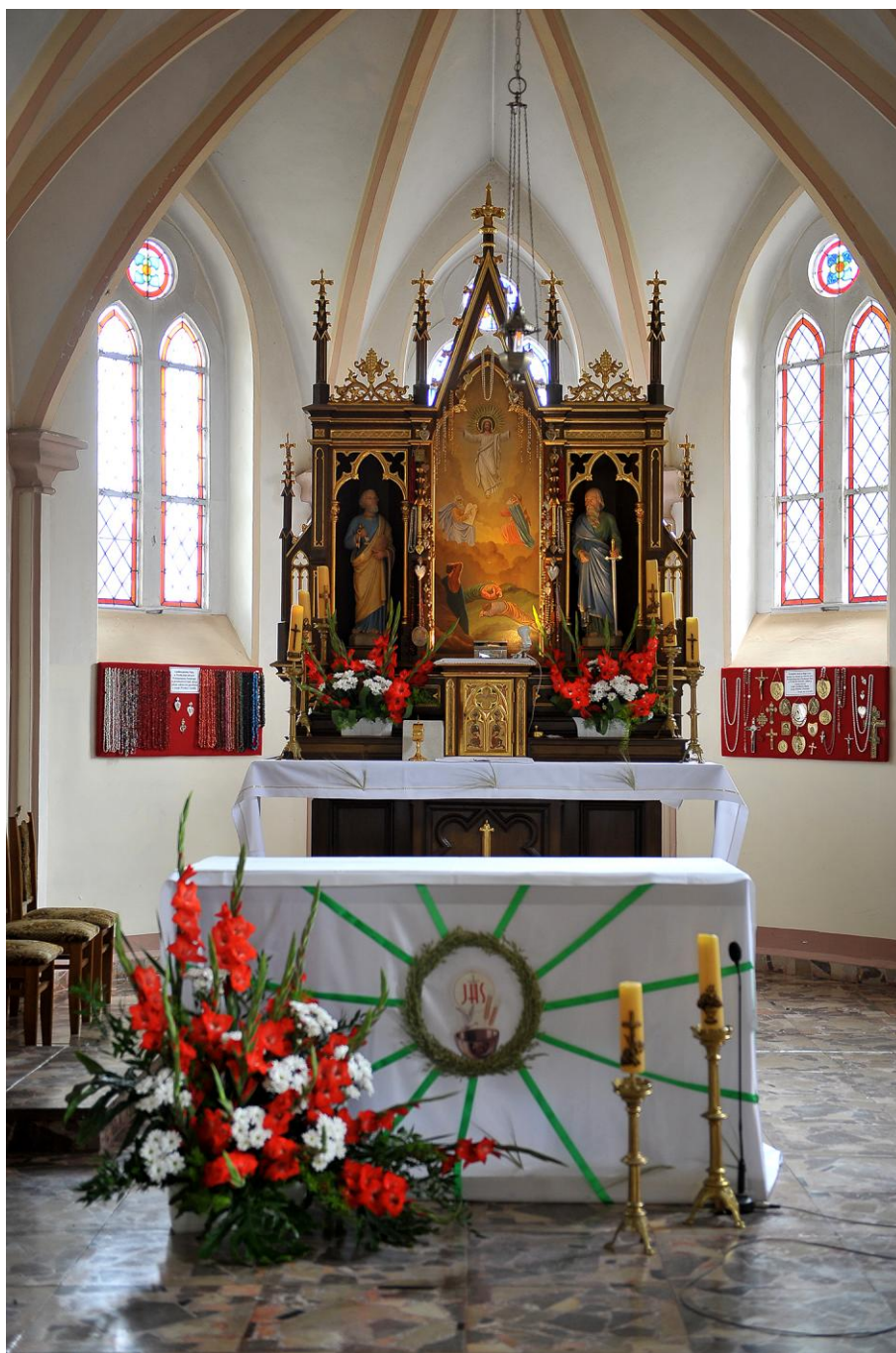
Łaskami słynący Obraz Przemienienia Pańskiego