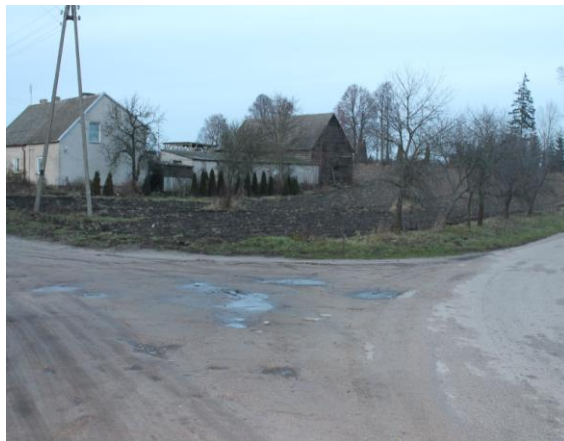
Droga gminna 186028N i droga gminna 186029 N Przełęk – Kościelny- Gródki