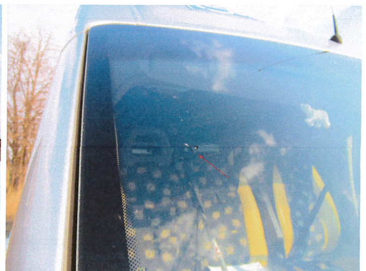
Szyba przednia odbita warstwa szkła 1