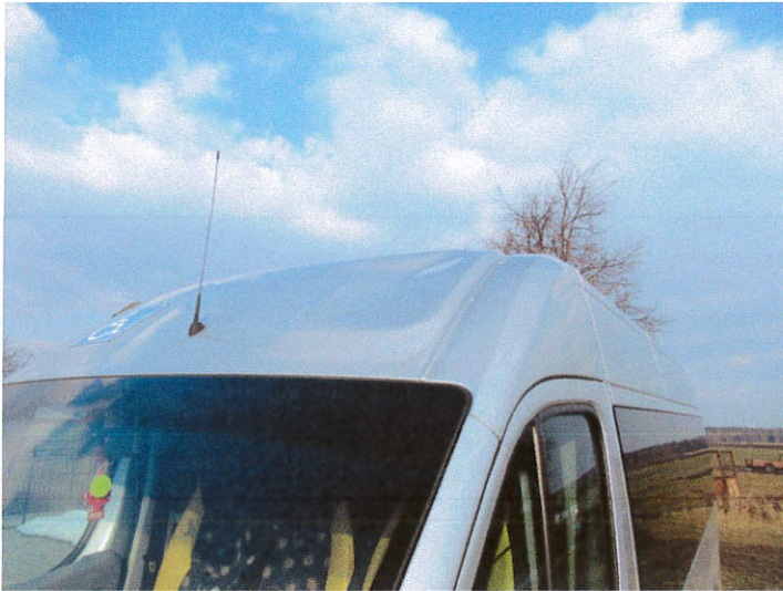
widok uszkodzonego dachu nadwozia 1