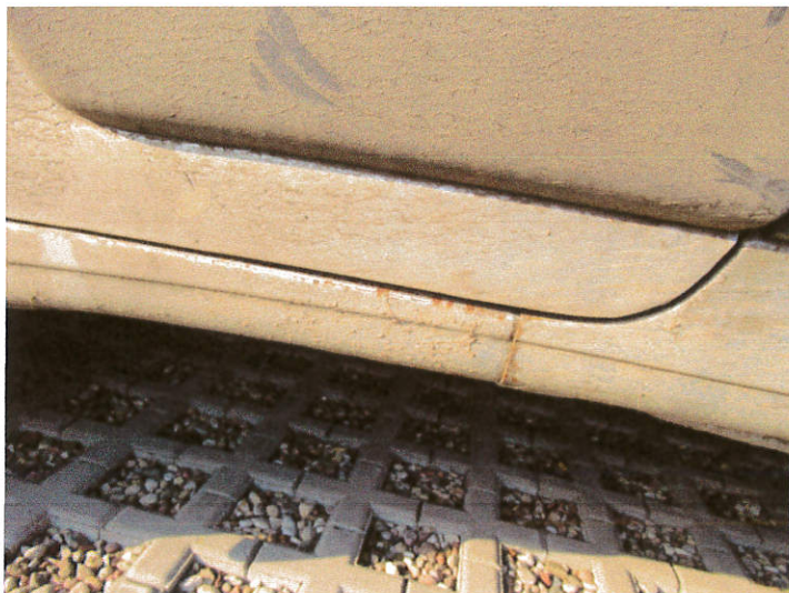
Próg drzwi lewych, ślady korozji1