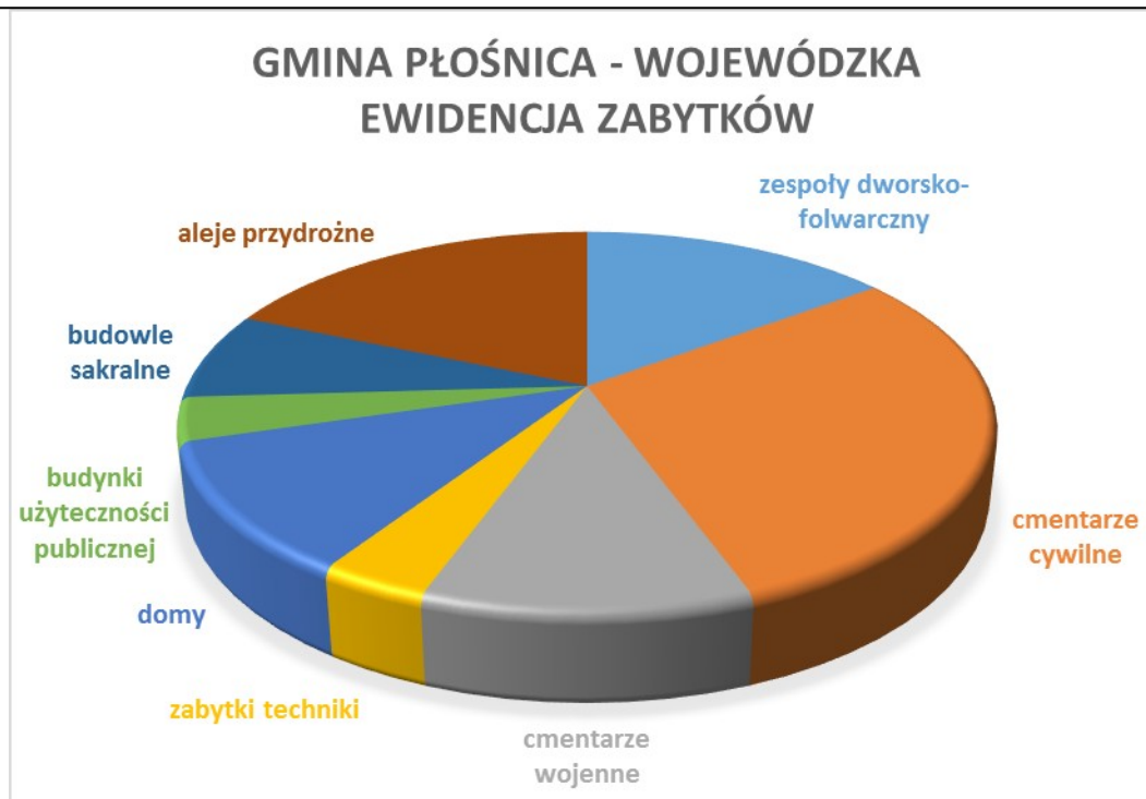
Wykres 3. Gmina Płośnica. Proporcje poszczególnych kategorii funkcjonalnych obiektów zabytkowych ujętych w gminnej ewidencji zabytków, z wyłączeniem obiektów objętych ochroną prawną poprzez wpis do rejestru zabytków województwa warmińsko-mazurskiego.